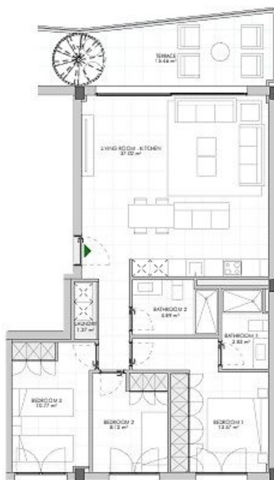
ATICO 1 - 75